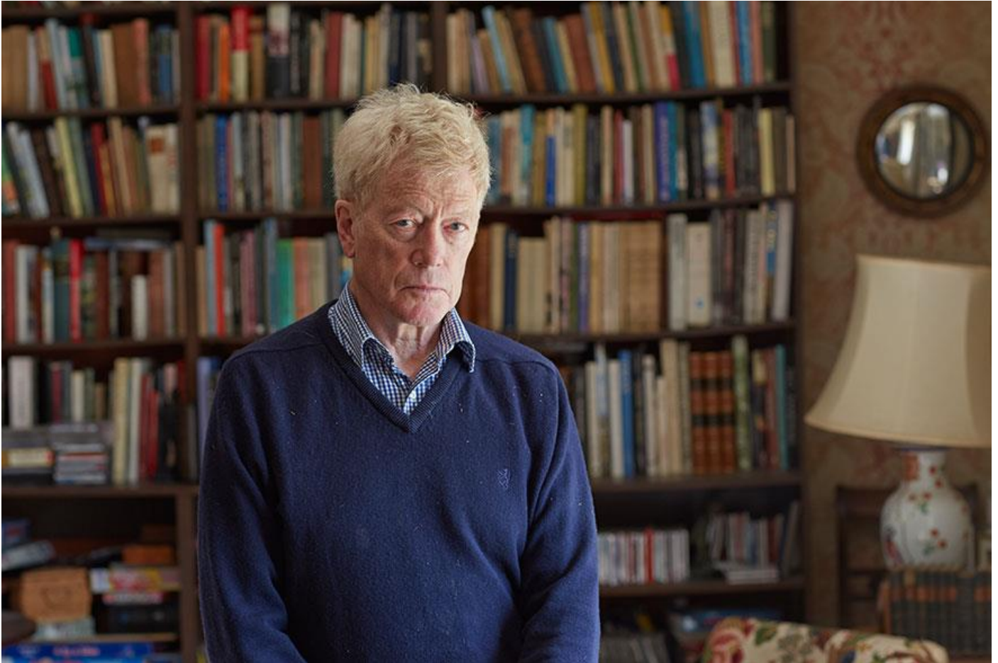
Ρότζερ Σκρούτον

συναίσθημα ότι τα καλά πράγματα καταστρέφονται εύκολα, αλλά δεν δημιουργούνται εύκολα». Και ποια είναι αυτά τα πράγματα που περιφρουρεί ο συντηρητικός; «Η δυνατότητα να ζούμε όπως επιθυμούμε, η ασφάλεια του αμερόληπτου νόμου, μέσω του οποίου απαντώνται τα παράπονά μας και αποκαθίστανται τα τραύματά μας, η προστασία του περιβάλλοντός μας ως κοινής περιουσίας, η οποία δεν μπορεί να κατασχεθεί ούτε να καταστραφεί από την ιδιοτροπία των ισχυρών συμφερόντων, η ανοιχτή και φιλοπερίεργη κουλτούρα που έχει διαμορφώσει τα σχολεία και τα πανεπιστήμιά μας, οι δημοκρατικές διαδικασίες που μας επιτρέπουν να εκλέγουμε τους εκπροσώπους μας και να ψηφίζουμε τους νόμους μας».