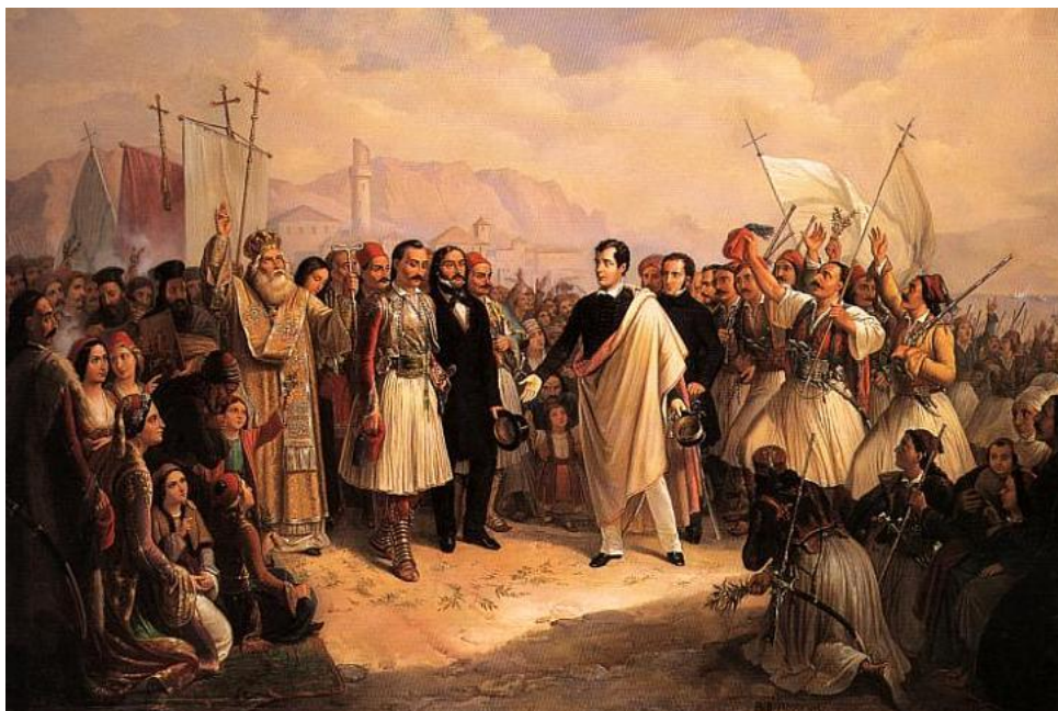
«Η υποδοχή του λόρδου Βύρωνα στο Μεσολόγγι», 1861, Αθήνα, Εθνική Πινακοθήκη, Θεόδωρος Βρυζάκης (1814-1878). Το γεγονός συνέβη 5 Ιανουαρίου 1824. Με το μαύρο παλτό απεικονίζεται ο Αλέξανδρος Μαυροκορδάτος.