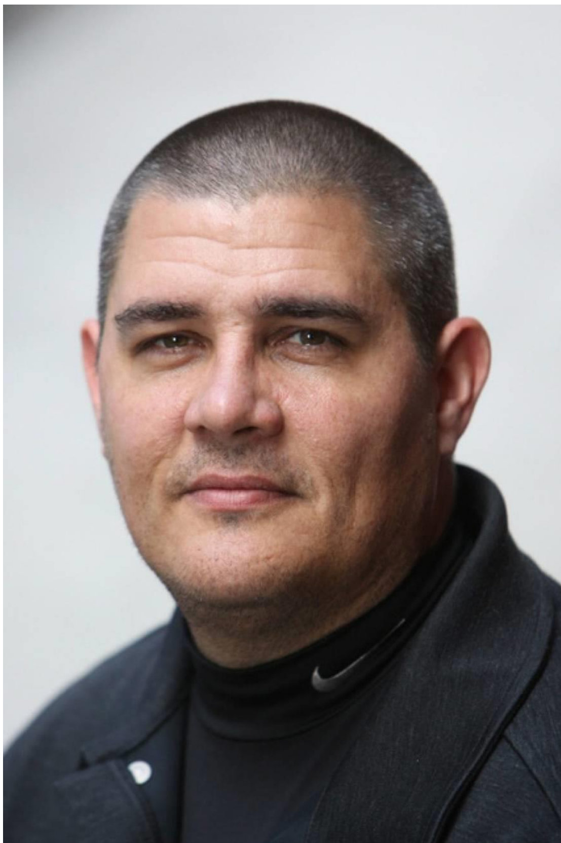
Ο συγγραφέας Adam Johnson