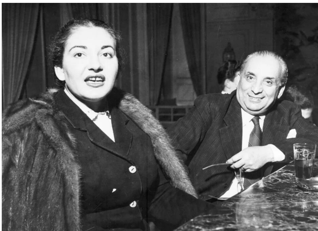
Η Μαρία Κάλλας με τον σύζυγό της Μενεγκίνι, όταν ακόμα είχε πολλά κιλά

«Με κυριεύουν ξαφνικές τάσεις τρυφερότητας», έλεγε, «και αμέσως μετά νιώθω ντροπή γι' αυτό». Σύρθηκε από το αυτοκίνητο ως την άκρη του δρόμου, αλλά τη γλίτωσε με μικρά τραύματα και μια διάσειση. Ωστόσο, η Λίτσα ισχυριζόταν ότι αυτό το ατύχημα άλλαξε τον χαρακτήρα της Μαρίας: έγινε κυκλοθυμική και έβλεπε την αδελφή της ως ανταγωνίστρια, αίσθημα που πήγαζε ίσως από τη στάση της μητέρας της, που δήλωνε ότι η Τζάκι ήταν πιο όμορφη και πιο ικανή. Για να προσελκύσει την προσοχή, θετικά ή αρνητικά, διέκοπτε τα μαθήματα πιάνου της Τζάκι, μπαίνοντας κάτω από την πιανόλα και πιέζοντας τα πεντάλ με τα χέρια της. Σύντομα, όμως, άρχισε κι εκείνη να κάνει μαθήματα, αν και ο Γιώργος το θεωρούσε πεταμένα λεφτά.