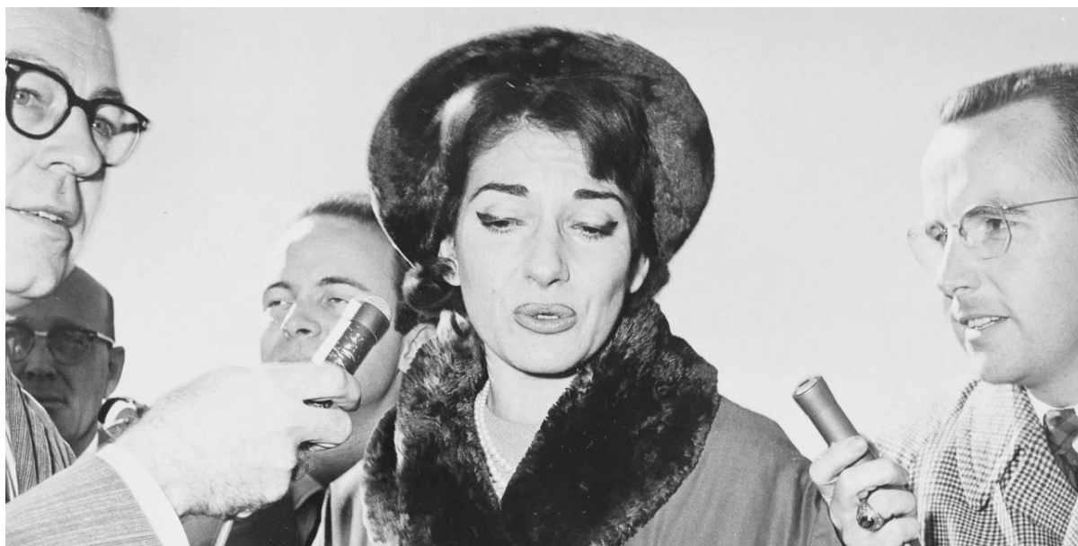
Η Μαρία Κάλλας περιτριγυρισμένη από δημοσιογράφους στο Τέξας, το 1959 / Φωτογραφία: AP Photo/Carl E. Linde