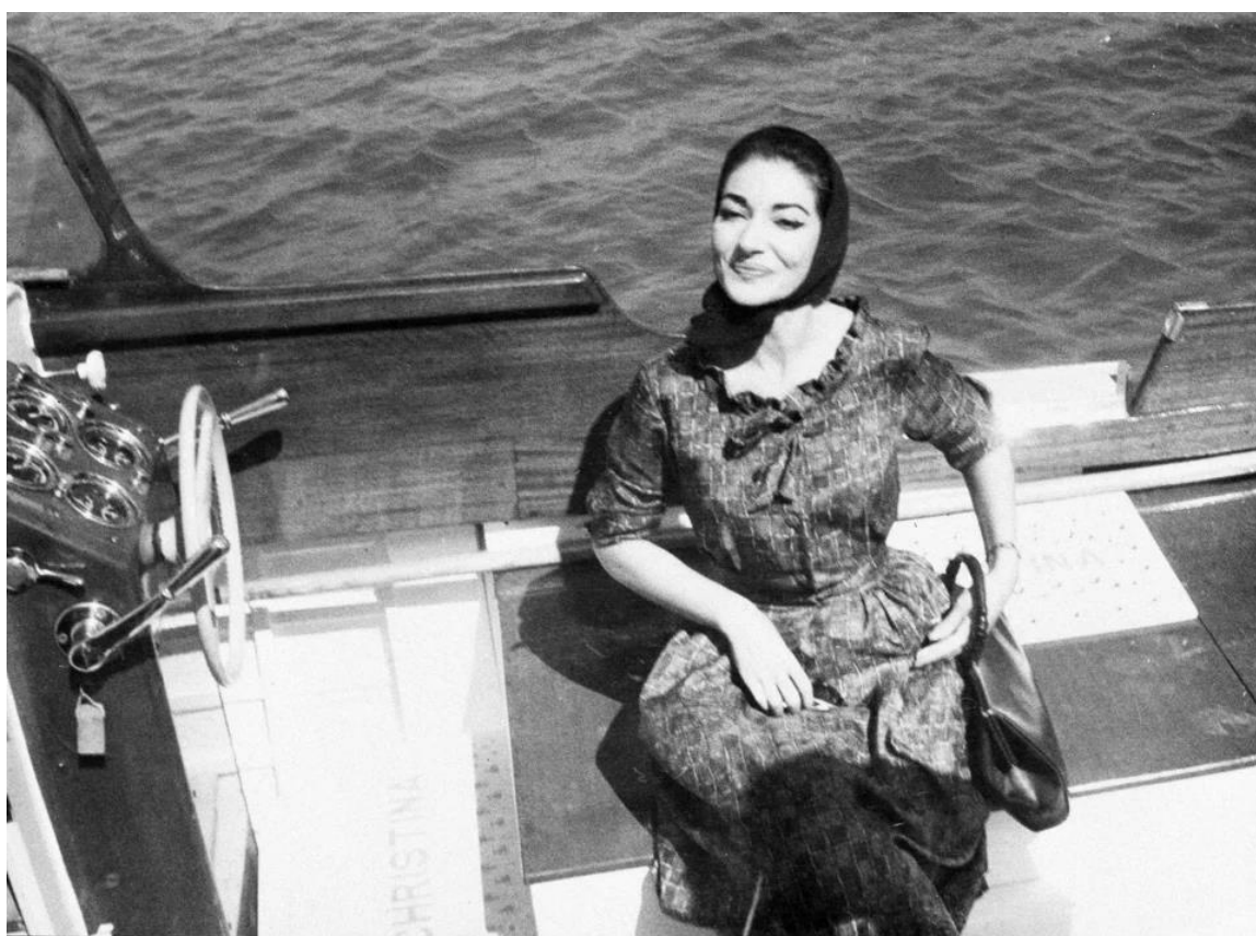
Η Μαρία Κάλλας, το 1959, λίγο πριν επιβιβαστεί στη θαλαμηγό «Χριστίνα», του Αριστοτέλη Ωνάση

Στο Ρίο ντε Τζανέιρο η Μαρία θα βίωνε κάποιες δυσάρεστες καταστάσεις. Το πρώτο επεισόδιο συνέβη όταν ένας σερβιτόρος της έφερε πρωινό στο δωμάτιο του ξενοδοχείου και, βρίσκοντάς την μόνη, επιχείρησε να της ριχτεί. Εκείνη τον απώθησε με τέτοια δύναμη, που χτύπησε κι έσκισε το κεφάλι του στο πόμολο της πόρτας. Στη συνέχεια τον πήγαν στο νοσοκομείο και ήρθαν αστυνομικοί να της πάρουν κατάθεση. Αντί για τον πραγματικό αυτουργό, αντιμετώπισαν την ίδια ως βίαιο δράστη, αν και δεν δόθηκε συνέχεια στο θέμα, και τελικά άλλαξε ξενοδοχείο.