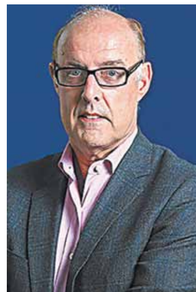
Ο Ντέιβιντ Καναντίν

Πιστεύω πως, ναι, αυτή η αλλαγή θα ερχόταν ασχέτως αν είχε εκλεγεί η Θάτσερ ή όχι. Η διαφορά είναι ότι η ίδια καλωσόρισε αυτή τη στροφή και αποκόμισε πολιτικά οφέλη με τρόπους