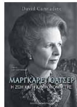
David Cannadine ΜΑΡΓΚΑΡΕΤ ΘΑΤΣΕΡ

Η γενική παραδοχή, ανάμεσα σε φίλους και εχθρούς της, είναι ότι η Θάτσερ δεν διέθετε καμιά αίσθηση του χιούμορ. Τα αστεία που έλεγε στις ομιλίες της ήταν όλα δανεισμένα από άλλους – και συνήθως έπρεπε να της τα εξηγούν πριν τα πει.