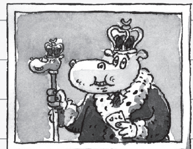
Η Αυτού Μεγαλειότης

3 Τι νόημα έκανε ο βασιλιάς στην κα Κατσικά;