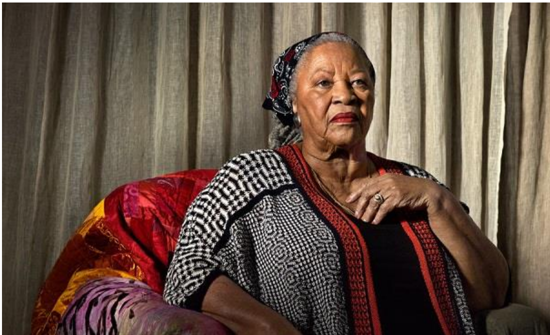
Η Toni Morrison

Μόνο που η Μόρισον δεν μεταφέρει στο μυθιστόρημά της μόνο την επιδραστική δύναμη που είχε η jazz στην αφροαμερικανική κουλτούρα, αλλά καταφέρνει να αποδώσει μια περίοδο της ζωής των ομόφυλών της μέσα από ένα συγκεκριμένο φακό. Μεταφερόμαστε στα μέσα της δεκαετίας του '20, στο Χάρλεμ ή, σύμφωνα με τη σημειολογία που αποδίδει στην περιοχή η Μόρισον, στην Πόλη (με το αρχίγραμμα κεφαλαίο).