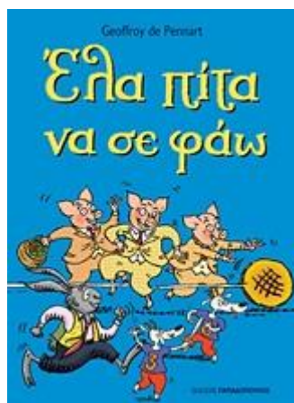
Έλα πίτα να σε φάω

Για να συστήσουν στα παιδιά τους τον κόσμο του Ζωφρουά ντε Πενάρ, όπου ο Λύκος δεν επιβεβαιώνει τη φήμη του, τα επτά κατσικάκια, τα τρία γουρουνάκια και όλα τα φαινομενικά αδύναμα πλάσματα αποδεικνύονται γενναία και κυρίως μεγαλόψυχα.