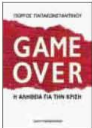
«Game Over», Πάγγρος Παπακωνσταντίνου, εκδ. Παπαδόπουλος, σελ.428

έχει «παράτηθε της ιδέας», όπως λέτε. Το ζήτημα είναι εμείς να μη δίνουμε επιχειρήματα και αφορμές σε παράμοια σχέδια, όπως έγινε δυστυχώς με την ανεκδιήγητη «διαπραγμάτευση» του πρώτου εξμήνου του 2015.