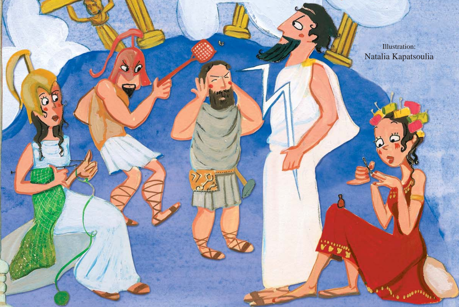
Illustration: Natalia Kapatsoulia