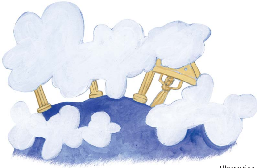
Illustration Natalia Kapatsoulia