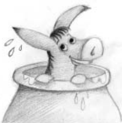
Εικονογράφηση Γιώργος Σγουρός