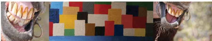
ΥΔΡΑ: Πάνος Κορωνάκης, Ελαιογραφία, 2012