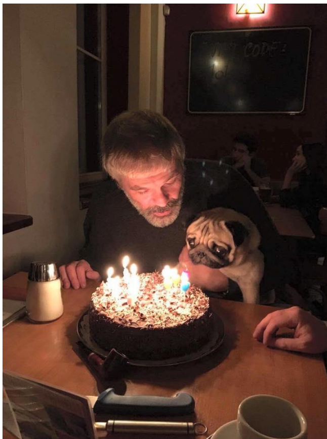
στα γενέθλια του δεύτερου