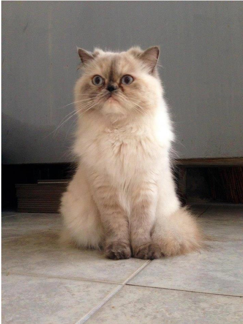
Η Φαντομά. Ήρεμη δύναμη.