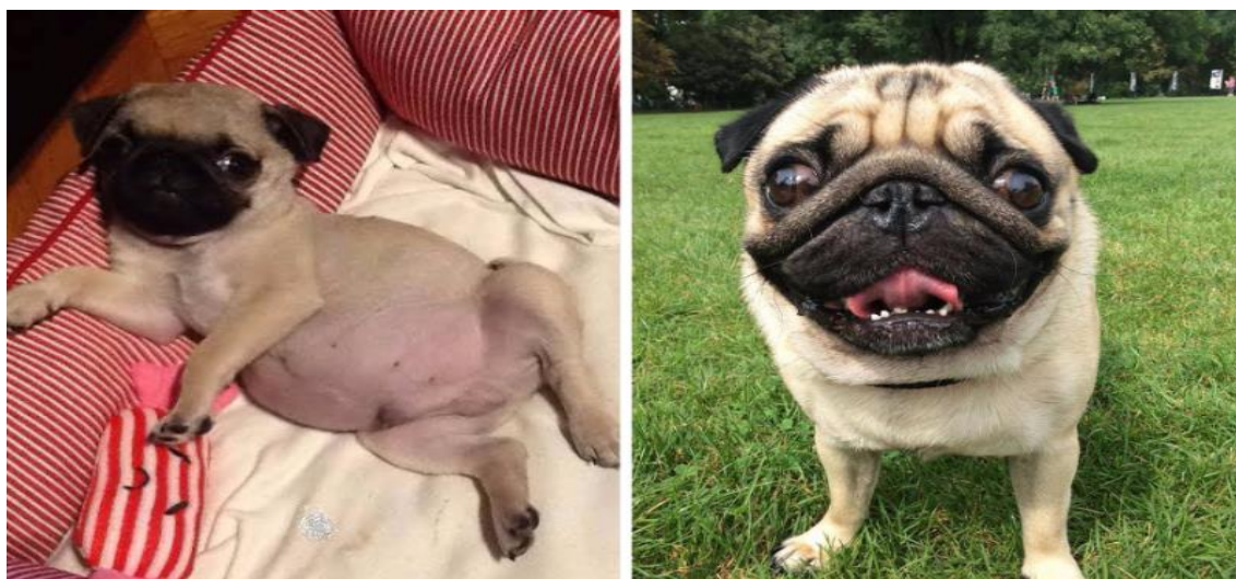
Ο Αρσέν μωρό (αριστερά) και σήμερα

Συνέβαινε και ένα αστείο στη Θεσσαλονίκη. Ήμασταν και οι δύο, και εγώ και η Κίκα, συνηθισμένοι να συστηνόμαστε σε ανθρώπους που μας ήξεραν, εκείνην πολύ περισσότερο βέβαια από την τηλεόραση, εμένα από το Facebook (και όχι από τα βιβλία, φυσικά). Με τον Αρσέν, δεν υπήρχε περίπτωση να μη μας σταματήσουν φωνάζοντας το όνομά του και να μην πέσουν επάνω του για να τον αγκαλιάσουν. Κάθε μέρα, κάθε φορά. Ποτέ δεν το έκαναν για μένα αυτό. Και έπαψαν να το κάνουν ακόμη και για την Κίκα από ένα σημείο και μετά. Μόνο για τον μικρό. Οπότε, ναι, τον ξέρουν σχεδόν οι πάντες. Για τους υπόλοιπους, προτείνουμε τη Σελίδα των παιδιών – με μία υποσημείωση: δεν διακρίνονται αμέσως οι χαρακτήρες τους, θέλει αρκετές ημέρες παρακολούθηση για να τους μάθεις. Αλλά περνάς καλά, υποθέτουμε.