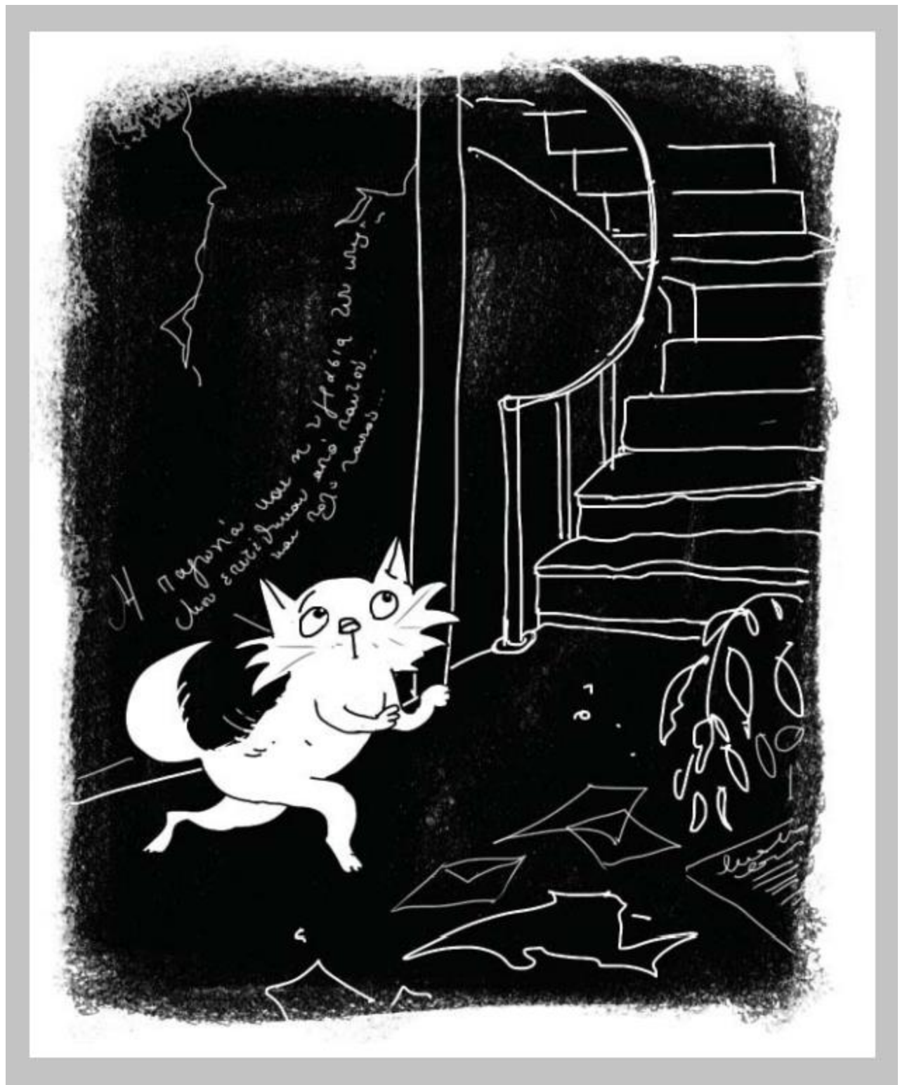
Μία από τις ζωγραφιές της Ναταλίας Καπατσούλια από το εσωτερικό του βιβλίου.