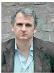
Ο Τιμόθι Σνάιντερ, καθηγητής Ιστορίας στο Πανεπιστήμιο του Γέιλ.

— Οι πολιτικοί, όπως και οι δημοσιογράφοι, οφείλουν να αντιλαμβάνονται την πολιτική σε συνάρτηση με το τι έχει συμβεί στο παρελθόν